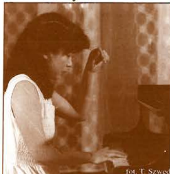
fol. T. Szwed

1. Od sierpnia 1995r. do października br. odbyło się łącznie 57 koncertów z udziałem 62 solistów z 7 krajów (Chiny, Dania, Japonia, Kanada, Polska, Rosja, Włochy). Najwięcej wystąpiło Polaków - 27, Japończyków - 10 i Rosjan - 7 osób. Odbyło się 8 recitali i 49 koncertów z większą ilością wykonawców - w tym 8 koncertów uczestników Międzynarodowych Mistrzowskich Kursów Pianistycznych. Wystąpiło wówczas od 8 do 12 solistów w każdym koncercie. Z dziewięciu koncertów archiwalnie nagranych przez Radio Wrocław SA, trzy bezpośrednio transmitowano w programie regionalnym, pozostałe były już retransmitowane albo ich nagrania czekają na emisję. Trudności finansowe spowodowały konieczność całkowitego wstrzymania działalności koncertowej w listopadzie i w lutym oraz ograniczenie liczby koncertów w kilku innych miesiącach.