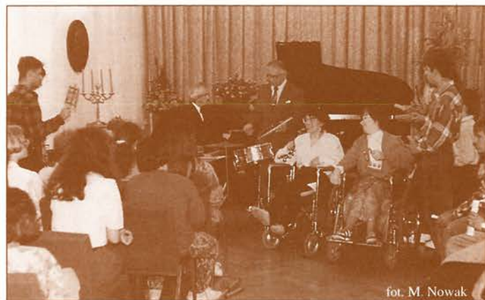
Wspólne muzykowanie na XXIX Koncercie Dedykowanym Sprawnym Inaczej Wrocław Klub Muzyki i Literatury 13. IX. 1995r.

Ostatnich 10 koncertów z tego cyklu miało bardzo szeroki zakres tematyki muzycznej i form prezentacji. Były recitale fortepianowe, koncerty wokalnie-instrumentalne, prezentacja około 30 instrumentów perkusyjnych połączona ze wspólnymi ze słuchaczami wykonaniami odpowiednio dobranych utworów, koncert jazzowy inspirowany folklorem brazylijskim, bardzo atrakcyjny pokaz gry na domrze i koncert kolęd.